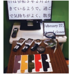
ロービジョングッズ