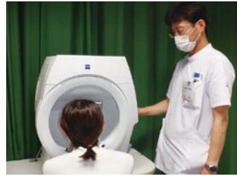
ハンフリー視野検査の様子