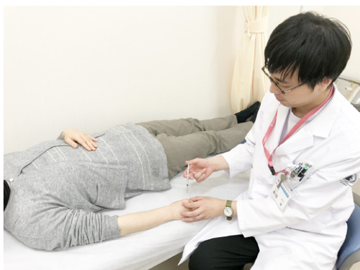
基本は全身的な治療ですが、必要に応じて局所治療を組み合わせます