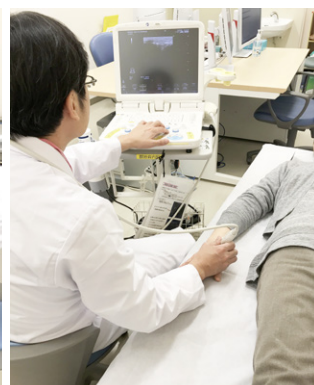
外来でも適宜、リウマチ超音波の資格を持つ医師が関節エコーを実施します