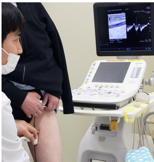
下肢静脈瘤の超音波検査

アレルギーの診断では国内最高レベルの診療を実施しており、全国の医療施設から検索依頼を受けています。皮膚テスト、アレルギー特異的IgE検査に加えて、誘発試験、免疫プロット、好塩基球活性化試験を適宜用いて、原因検索を行います。難治性皮膚アレルギー疾患に対しては生物学的製剤などの新規治療法を積極的に実施しています。