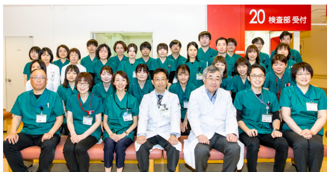
検査部スタッフの集合写真

検査部・輸血部・病理部では2017年に県内で初めてISO15189認定を取得しました。ISO 15189は、臨床検査室に特化した国際規格であり、「品質マネジメントシステムの要求事項」と「技術的要求事項」から構成されます。当院検査部は「マネジメントシステムを運営し、技術的に適格で妥当な結果を出す能力があることが認められた」検査室として、これからも信頼される良質な検査情報を提供し、日常診療はもとより、ゲノム医療や国際治験、医療ツーリズムなど医療のグローバル化にも貢献して参ります。