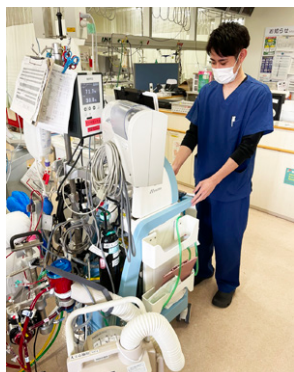
集中治療部 / ECMO業務