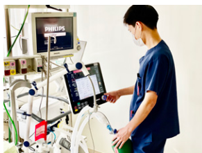
院内 / 人工呼吸器業務