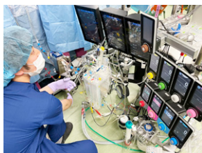
手術部 / 人工心肺業務

MEセンターは、2009年4月に開設され、センター長1名、副センター長（臨床工学技士長）1名、臨床工学技士17名、技能補佐員1名より構成され、院内の多職種職員と連携し、チーム医療の一員として、高度で安全な医療技術の提供に努めています。