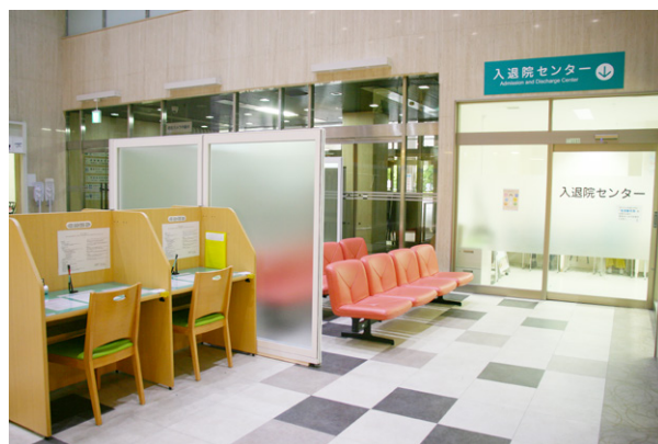
入退院センター入口