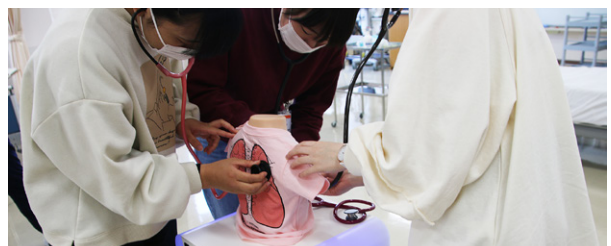
小児ラングの呼吸音聴診