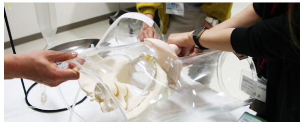
導尿トレーニング

島根大学医学部に2011年4月から開設した医学科専攻修士課程の「医療シミュレータ教育指導者養成コース」があります。近年、医療シミュレータの必要性が高まり、多くの大学や病院などでスキルスラボのような医療技術研修部門が設置されるようになりました。しかし、病院では医師不足、看護師不足の現実があり医療シミュレータを使用した教育を行う医療者を確保するのは非常に困難です。また医療シミュレータは人体の一部、若しくは疾患の一部を模擬化したものであり、医療知識のみならず装置の原理や構造を理解したうえで、効果的な指導を実践することが重要です。そのために医療シミュレータを使用して教育を行う専門の指導者を養成する必要があります。2022年3月までに医療シミュレータ教育指導者養成コースを卒業した医学修士が21名になりました。今後、島根県内および日本各地でシミュレーション教育が円滑に行われ教育効果の上昇が期待されます。