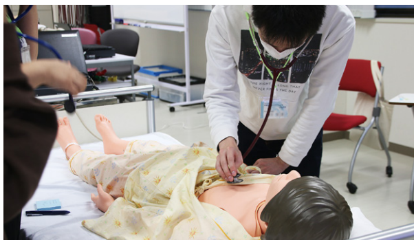
フィジコの心音聴診