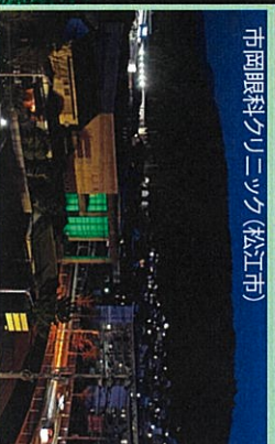
市岡眼科クリニック(松江市)