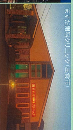
またすだ眼科クリニック(出雲市)