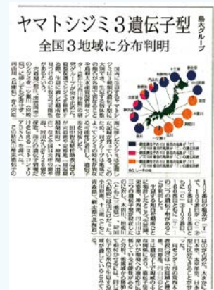
2015年1月15日 山陰中央新報 朝刊第1面