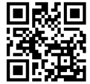
登録用二次元バーコード