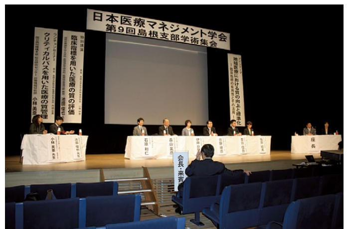
図2. 日本医療マネジメント学会第9回島根支部学術集会

※平成20年度から研修費については、従来各部署に配分されていた研修費も同センター研修費より拠出されることになったために増加したものです。