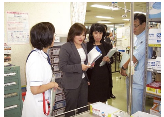
国立大学病院間相互チェック