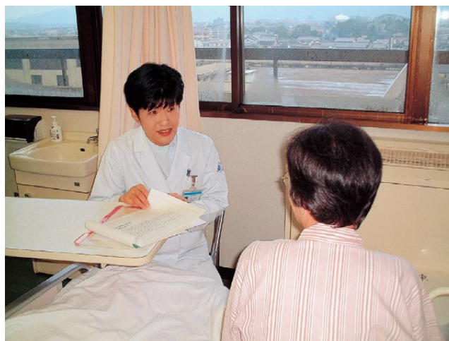
薬剤管理指導業務