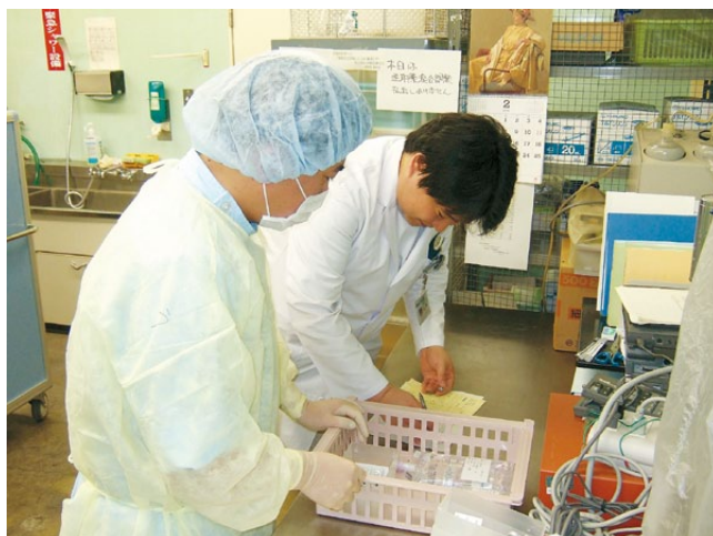
外来化学療法抗がん剤無菌調製後払い出し業務