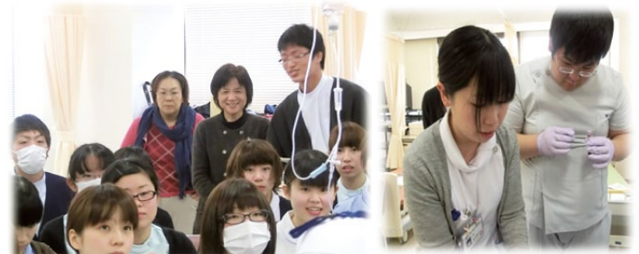
地域医療再生計画事業・地域の新人看護職員と研修風景