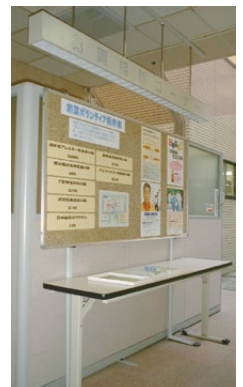
創薬ボランティア掲示板