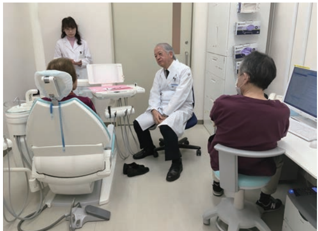
言語聴覚士との診療風景