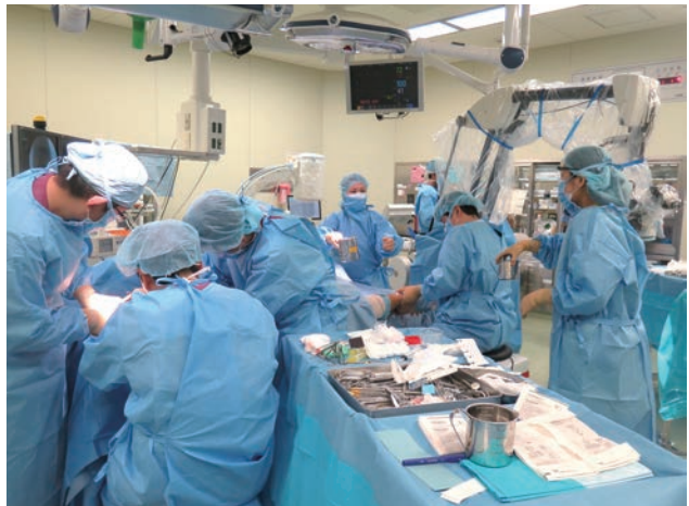
写真②整形外科による四肢の手術との合同手術の様子

顎顔面外傷センターでは、高度外傷センターおよび救命救急センターとの多角的連携治療のもと、関連する各診療科とも連携し、各種口腔顎顔面外傷手術に対し、最新最良の技術と器具機材、設備の元で治療に当たっています。(写真②)