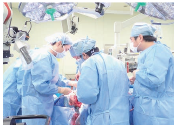
写真① 口腔がん拡大切除および形成外科とのマイクロサージャリーによる再建手術の様子

とくに進行口腔がん治療においては、関連する各診療科(耳鼻咽喉科、放射線治療科、放射線科、形成外科など)と密に連携し、各種ガイドラインに則りエビデンスを重視した安心安全な治療を提供しています。(写真①)