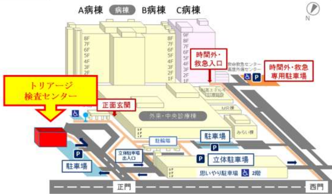
地図：トリアージ検査センター