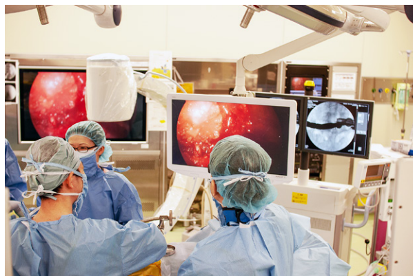
脊椎内視鏡下手術