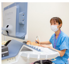
胎児スクリーニング外来