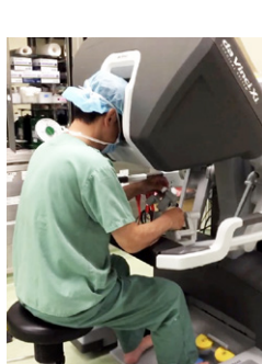
当科には 5 人のダビンチ認定術者が所属しています