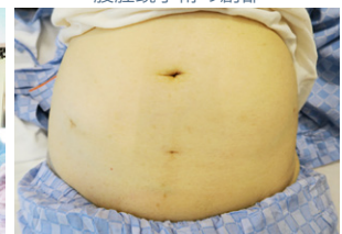
腹腔鏡下子宮がん手術の術後 1 週間の創部。傷は極めて小さく、1 週間で退院可能です