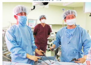
内視鏡技術認定医 5 名が在籍し、子宮がんに対する腹腔鏡手術の認定施設となっております