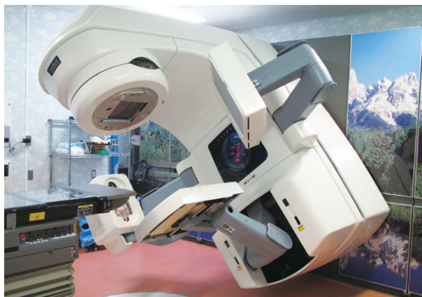
外部照射装置 (リニアック)

当院の放射線治療科の特長は、常にごがん治療チームでの活動を大切にしていることです。他の診療科の医師や緩和ケアチーム、看護師などの多くの職種のスタッフとともに目の前の患者さん一人一人に寄り添い、患者さんにとって最善の選択は何かということが一番に考えています。