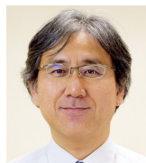
教授 長井 篤

専門分野: 出生前診断 周産期に関連した遺伝相談 遺伝性疾患全般 資格: 日本周産期・新生児医学会 周産期専門医・指導医 日本産科婦人科学会認定 産婦人科専門医・指導医 日本人類遺伝学会 臨床遺伝専門医 母体保護法指定医