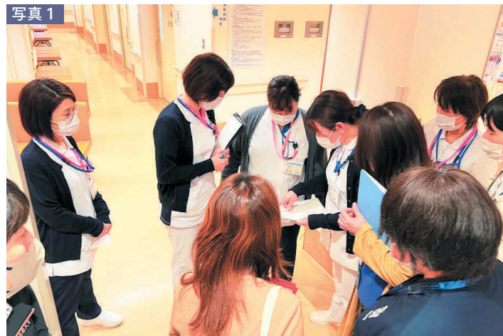
写真1 外来転倒転落対策チームによる現場ラウンドの様子

外来は患者さんの状態や利用環境が多様であるため、今後も多職種で連携しながら、安全で利用しやすい外来環境づくりを進めてまいります。