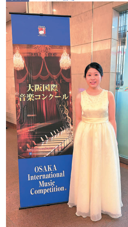
写真2 コンクール会場