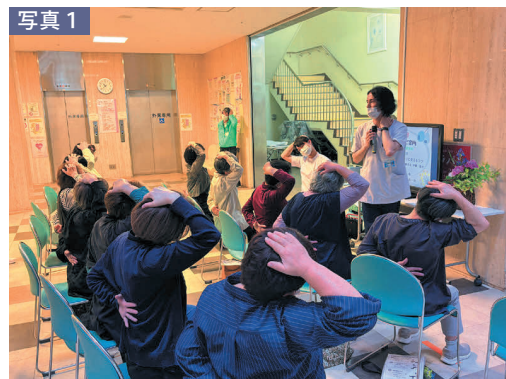
写真1 理学療法士による『健康講座』