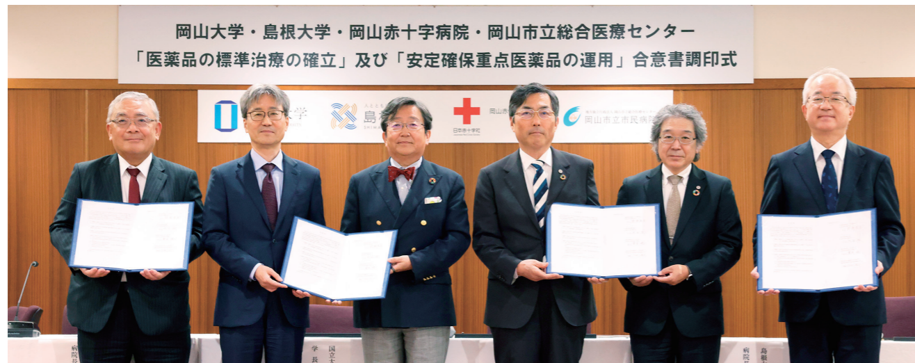
岡山大学・島根大学・岡山赤十字病院・岡山市立総合医療センター 「医薬品の標準治療の確立」及び「安定確保重点医薬品の運用」合意書調印式

近年は、特にジェネリック医薬品を中心に供給不安が生じており、医療現場では対応の負担が増大しています。本学の参画により、岡山地域で構築されてきた仕組みを広域に展開し、より安定した医療提供体制の確保を目指します。