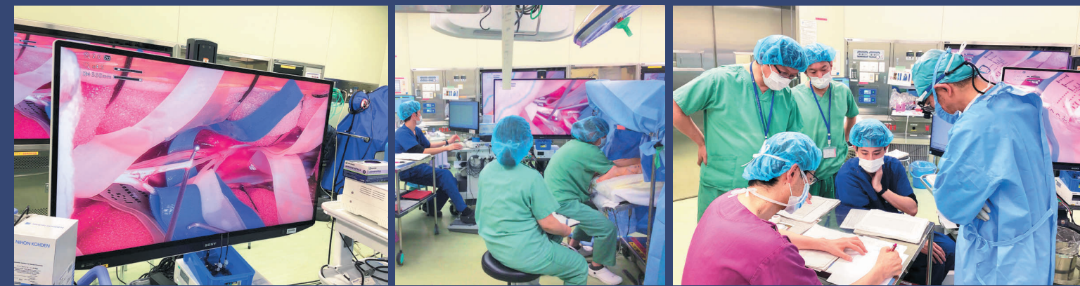
脊髄後根を選択的に刺激