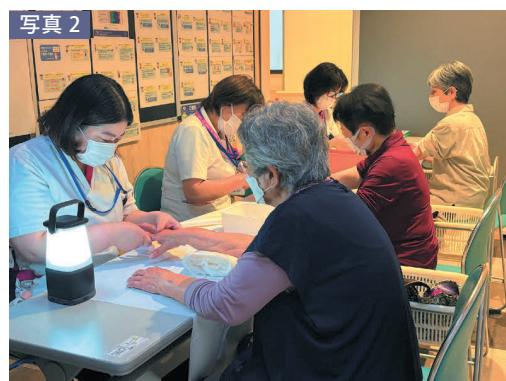
写真2 『ハンドマッサージ』の様子