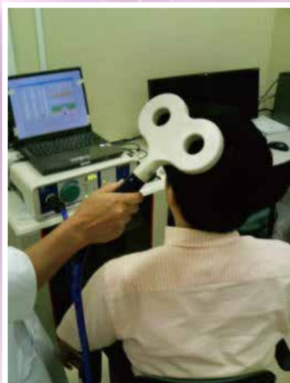
反復経頭蓋磁気刺激治療

神経内科が関わる疾患は非常に多岐にわたりますが、頻度が高い疾患は脳卒中です。当院では、急性期脳梗塞に対して血栓溶解治療薬(t-PA)が認可されて以降、積極的に投与を行っています。発症後4.5時間以内であれば治療の適応になる可能性があり、約3割の患者さんにおいて完全回復が望めます。リスクを有する患者さんに対しては当科への早期受診のご指導をよろしくお願いいたします。