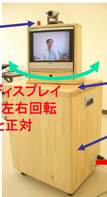
学校側ロボット 小学校の机サイズ