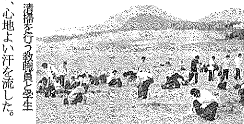
清掃を行う教職員と学生

鳥取大ではこうした動きに賛同し、鳥取砂丘景観保全協議会主催の除草事業に、平成十六年度から毎年参画している。