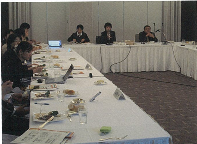
テーブルセッションによる女性医師交流会

今回、去る12月3日（土）神戸市内で島根大学医学部キャリア形成支援部門と島根大学医学部附属病院ワークライフバランス支援室が「女性医師フレキシブルコース」のキックオフミーティングを共催で開催しました。4大学の女性医師支援に関わる指導医や関係者、