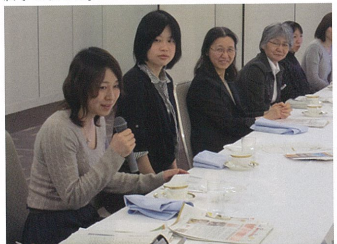
4大学女性医師による意見交換